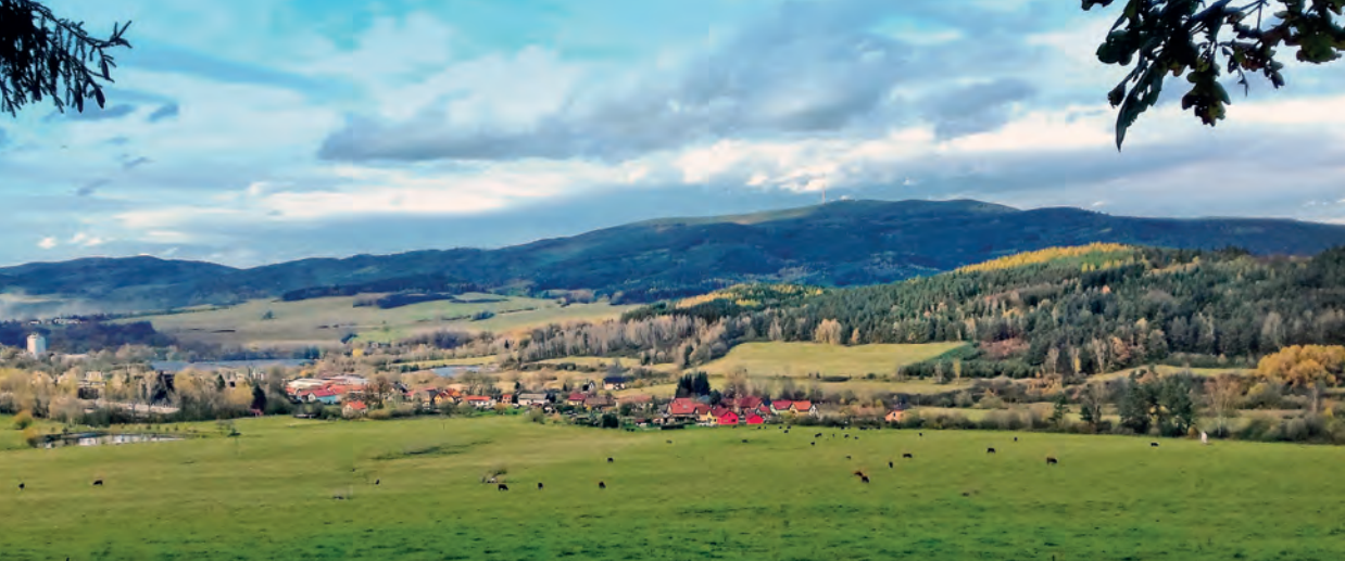
Pohled na Kladno od Záhorkova. Foto Jitka Radimská 2020