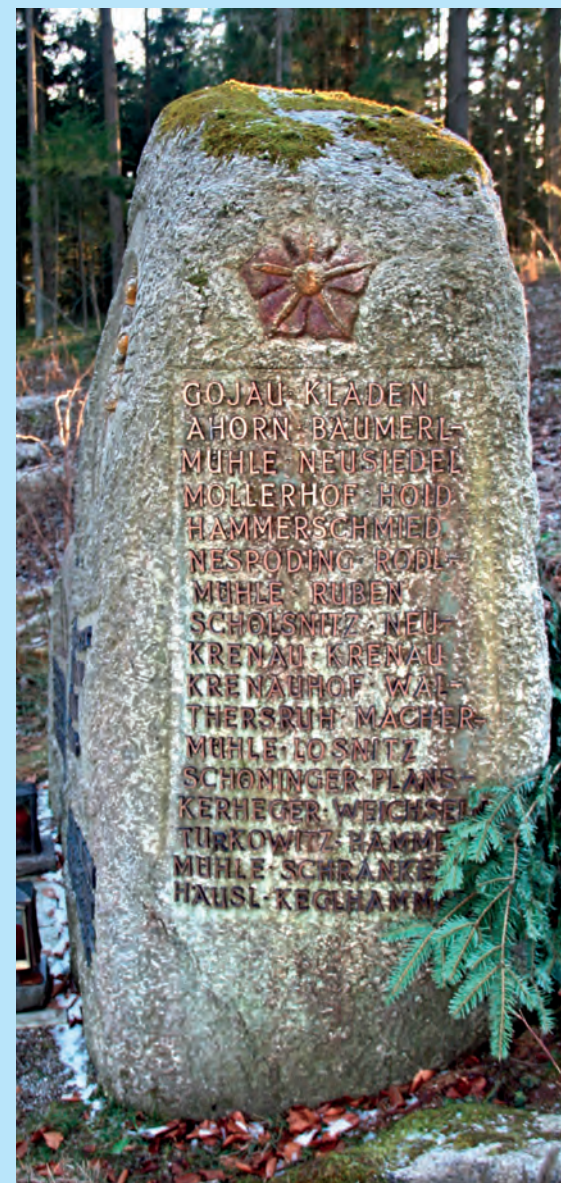
Soupis osad a významných samot z kájovské farnosti (německá forma názvů)