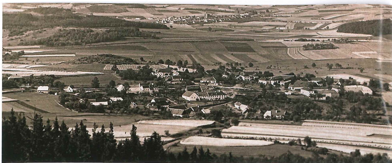
Pohled na Boletice z doby před první světovou válkou.