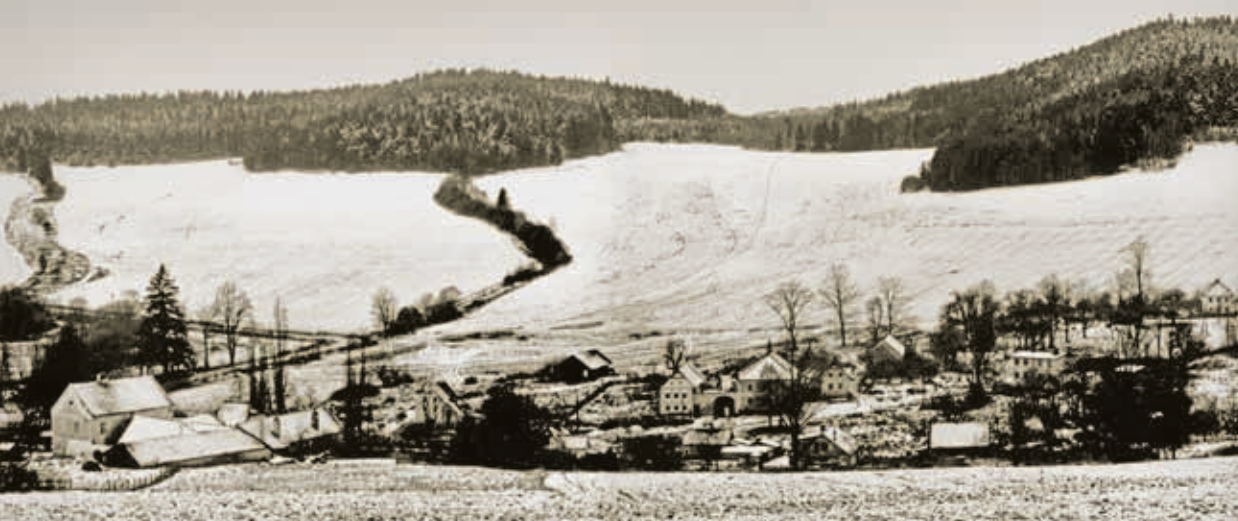
Pohled na Kladenské Rovné, 70. léta 20. století.