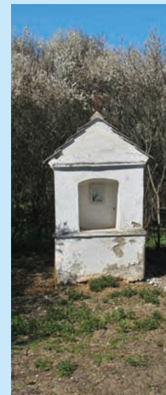
Kaplička vysvobozená z trní, 22. 4. 2020