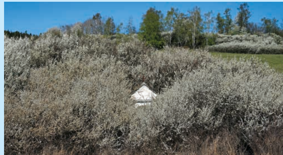
Kaplička zakletá v trní, 22. 4. 2019