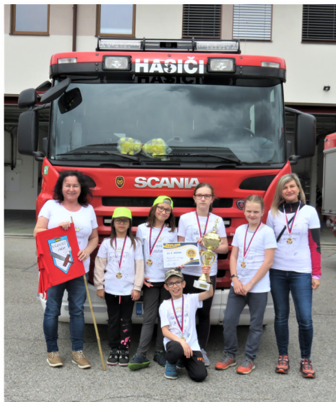
Vítězné družstvo Kájovské sirény s vedoucími