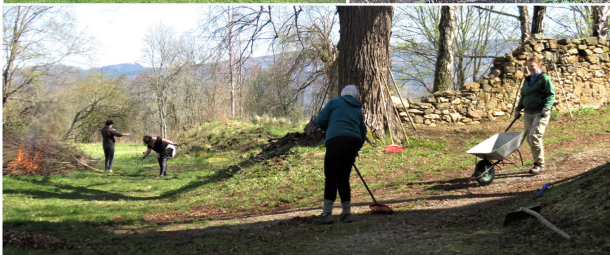
Fotky ze zakončení v Kájově, z úklidu v Novosedlech, Boleticích, Kladenském Rovněm a Křenově