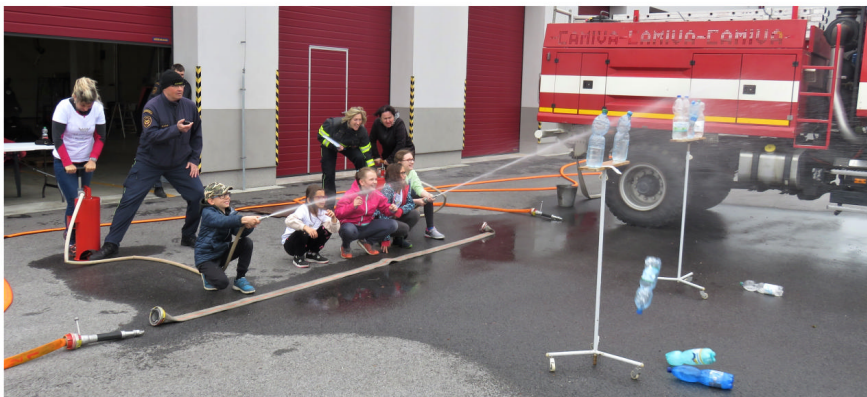
Kájovské sirény v akci