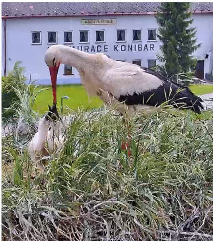
Kájovská čapí rodinka a hnízdo před obydlením