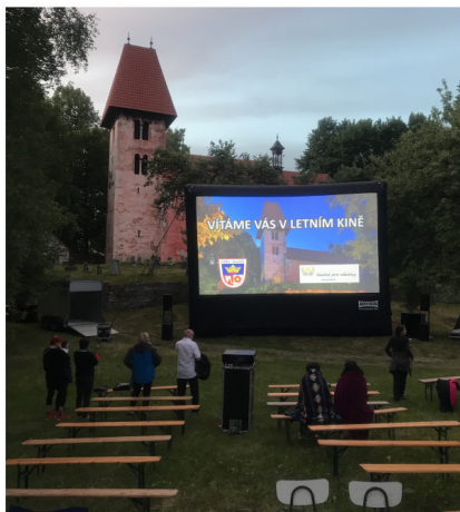
9. 6. se v Boleticích promítal film Údolí včel. Diváci se schází do mobilního letního kina

Do dalších let přejeme mnoho zdraví a pohody!